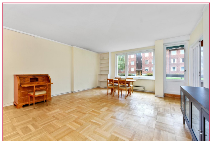
Stue mot balkong