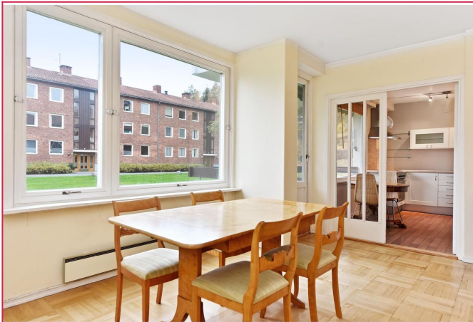
Stue mot kjøkken og balkong