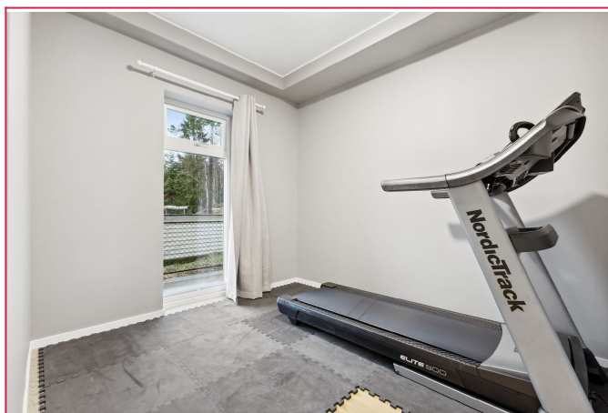
Soverom 2 - blir i dag brukt som treningsrom.