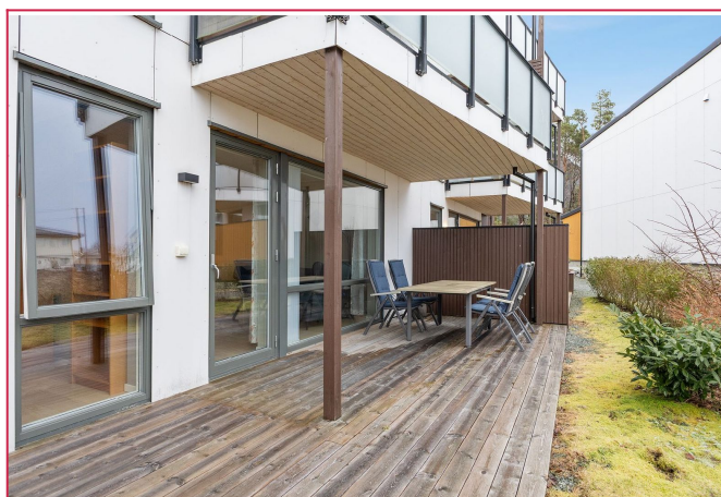
Terasse med utemøbler - Her kan man nyte solen i rolige omgivelser.