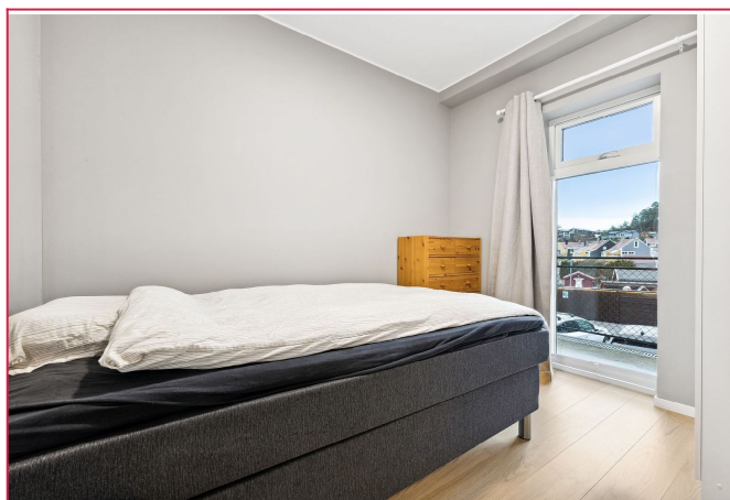
Hovedsoverom - rommet som i dag blir brukt som hovedsoverom