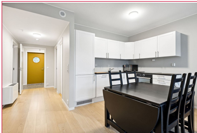
Oversiktsbilde Kjøkken, spisestue og hallen ut mot entré.