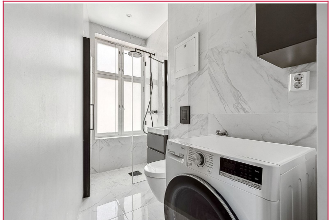
Moderne og stilrent bad med lyse fliser. Vaskemaskin medfølger.