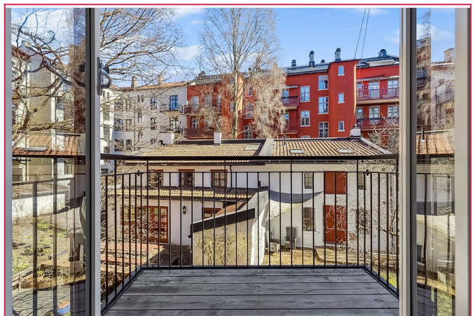
Koselig balkong som vender mot rolig bakgård.