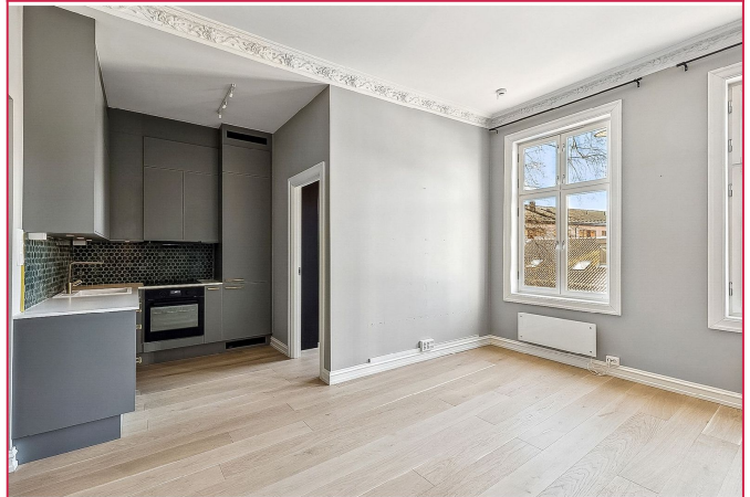
Åpen stue/kjøkken løsning. Store vindusflater med godt lysinnslipp.