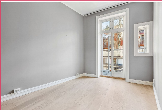
Lyst og romslig hovedsoverom med direkte adkomst til balkong.