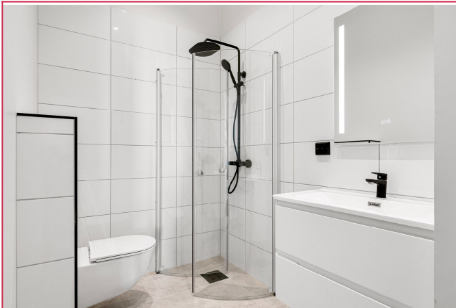
Moderne og stilrent bad