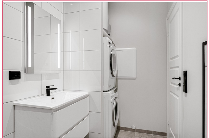
Medfølger vaskemaskin og tørketrommel