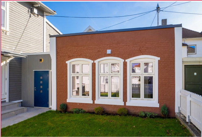
Leiligheten fremstår som et selvstendig anneks