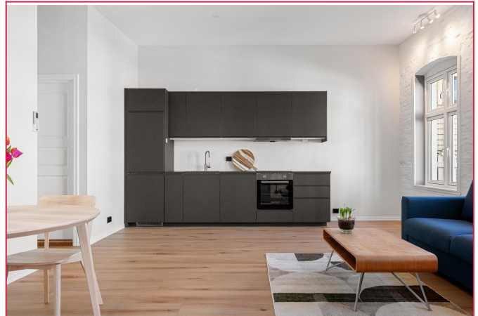
Kjøkken/stue i åpen løsning