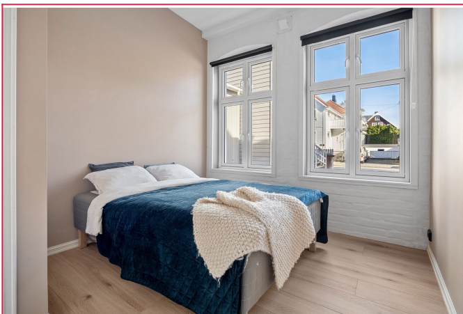
Soverom av god størrelse og mye lys