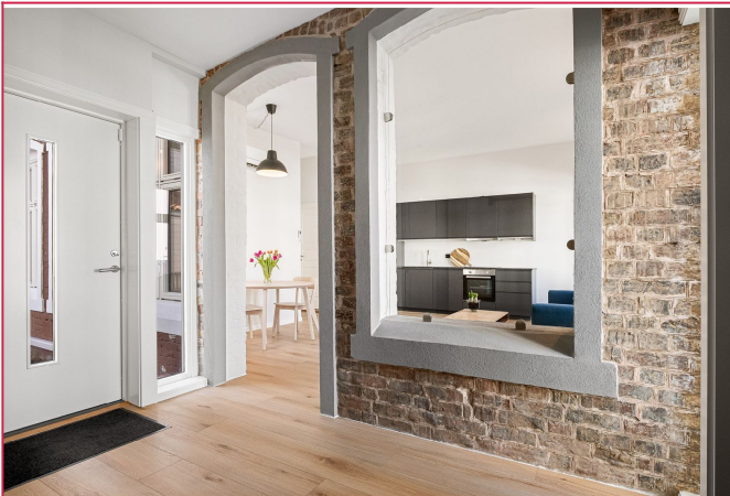
Utgang til baksiden av huset