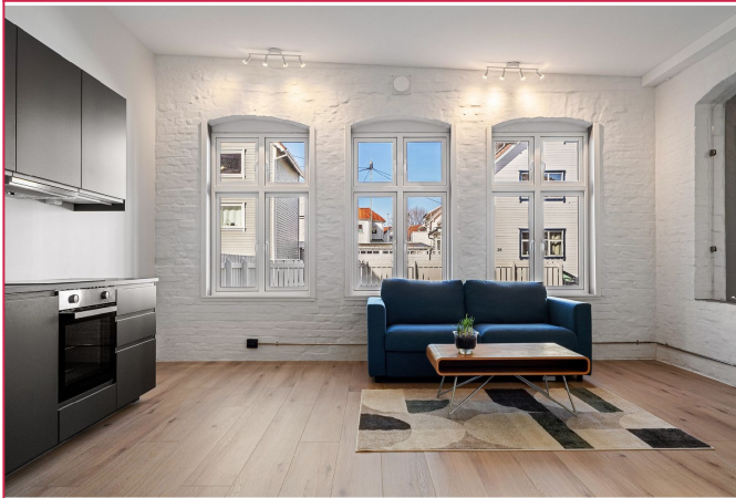
Leiligheten er blitt pusset opp helt fra bunnen