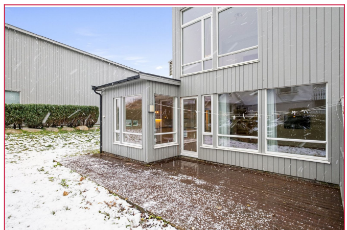
Innhukket på terrasse er et fint sted å nyte morgensolen, skjermet for vind og innsyn.