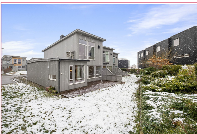
Boligen har egen terrasse og direkte adkomst til sin del av felles hage.