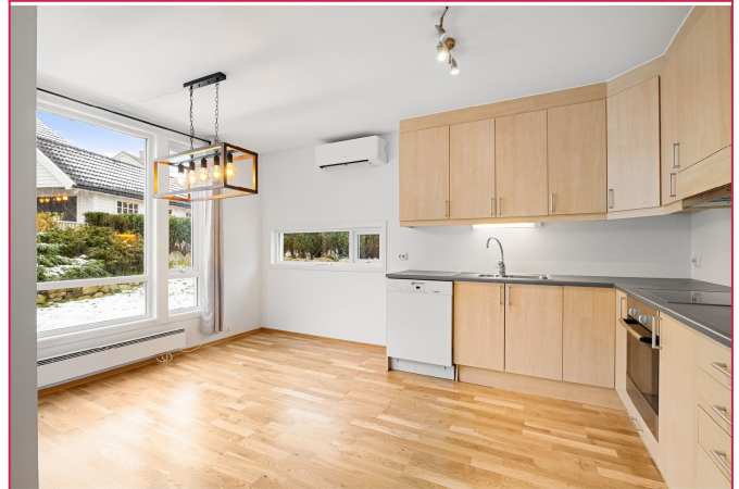
Praktisk kjøkken med mye benk- og skaplass.