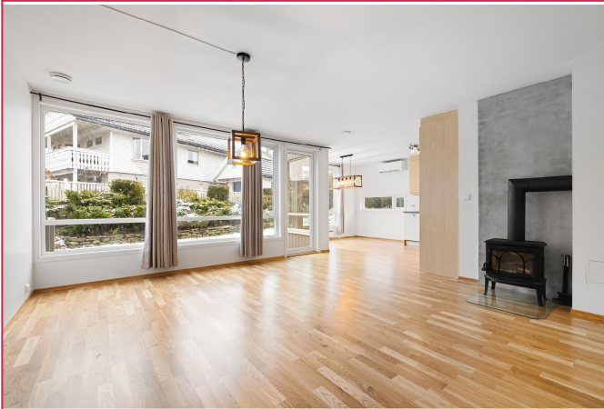
Lys og romslig stue med mange møbleringsmuligheter. Vedovn og varmepumpe til oppvarming.