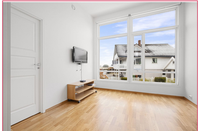
Soverom 4 evt. loftstue.