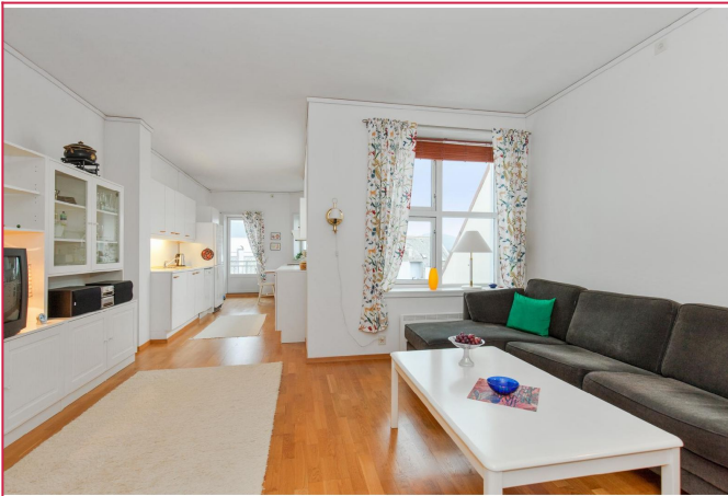
Det er kun tv benk og stuebord som står igjen.