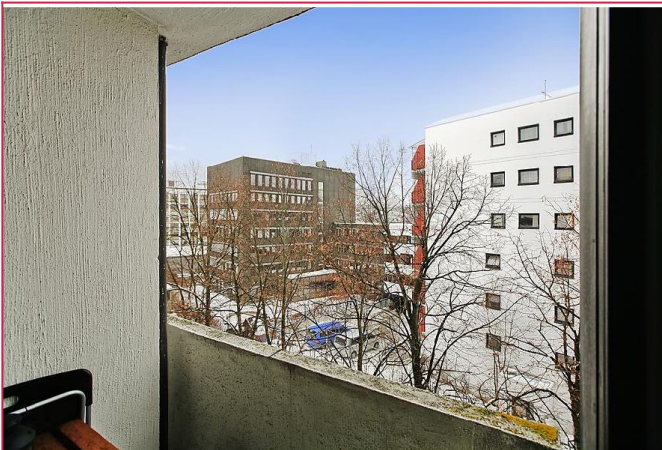
Fra stuen er det utgang til balkong.