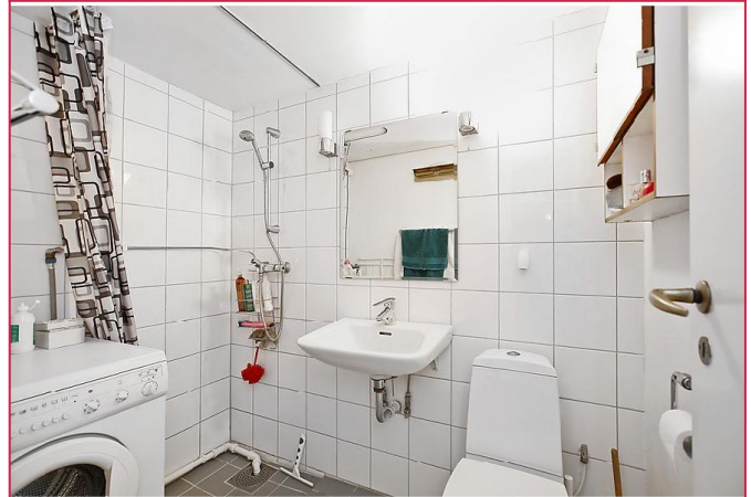
Flislagt bad med vaskemaskin.