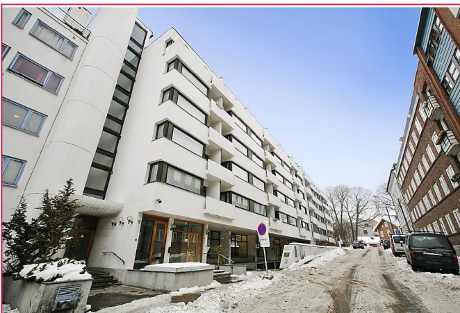
Leiligheten ligger i en rolig blindvei.