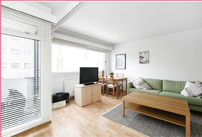
Leiligheten har en god planløsning med god plass til både sofa og spisebord.