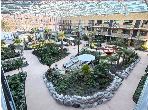
Fantastisk felles vinterhage