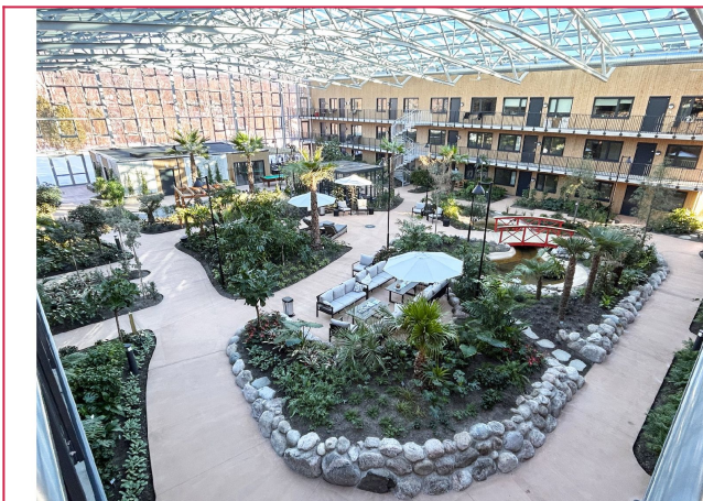
Nydelig felles vinterhage