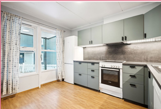
Nytt kjøkken med hvitevarer