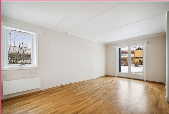
Stue med utgang terrasse