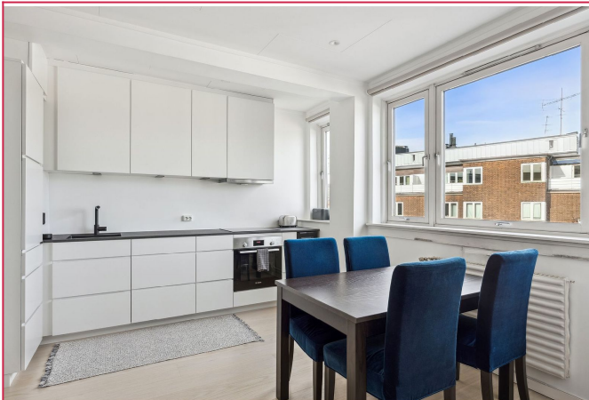
Moderne kjøkken med integrerte hvirevarer.