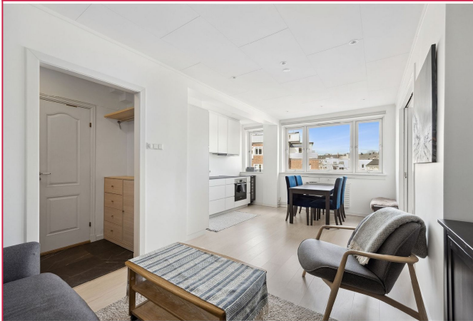
God og arealeffektiv planløsning, med luftige oppholdsrom.