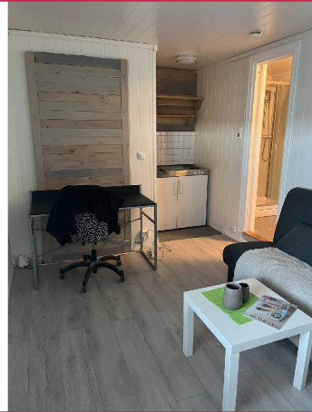
Plass til sofa, skrivepult og TV