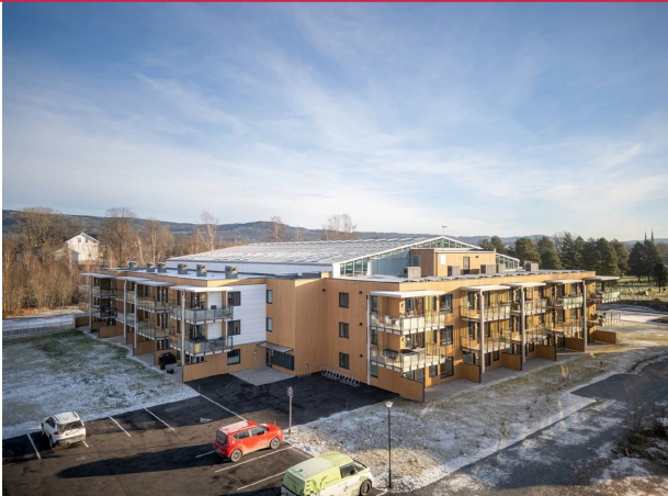
Velkommen til Bovieran