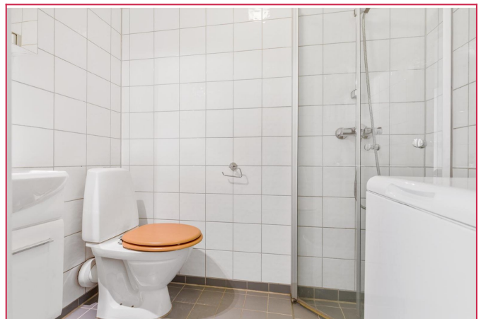
Pent bad med medfølgende vaskemaskin.