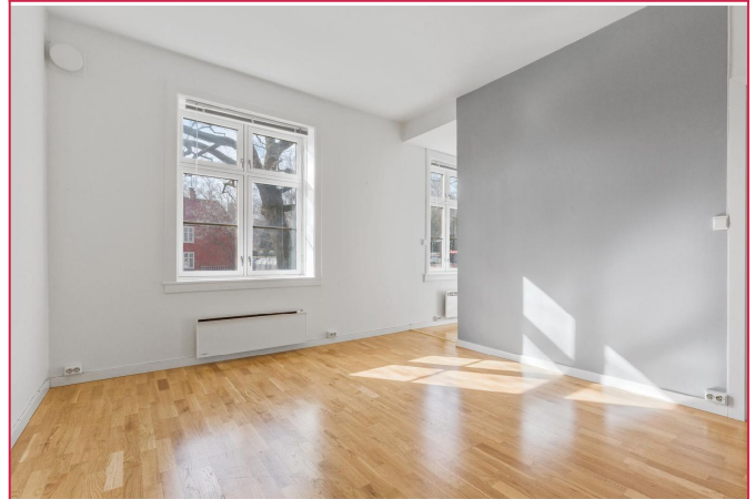
Lys og pen stue/sov.