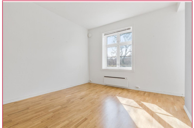
Leiligheten ligger i en høy førsteetasje med ingen innsyn.