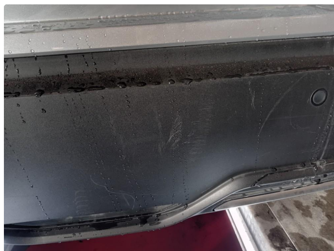
1.6 Diverse små riper