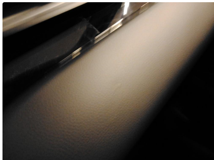
2.1 Skade i dashbordet