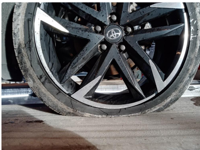
1.1 Punktert. Kan kanskje reparere