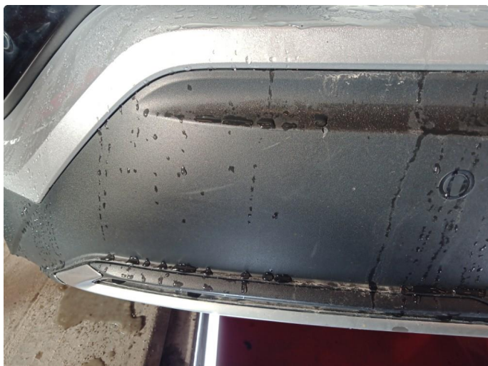
1.6 Diverse små riper