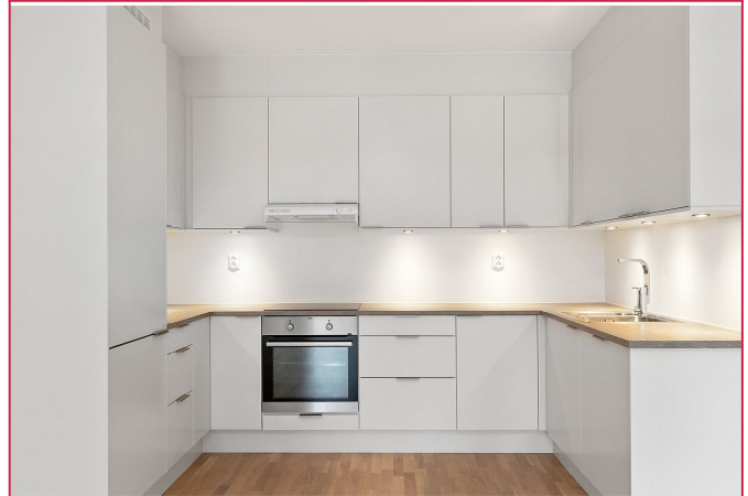
Åpen kjøkkenløsning med god skap- og benkeplass