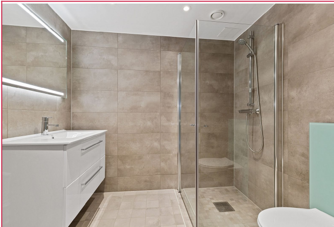
Lekker flislagt bad med opplegg til vaskemaskin