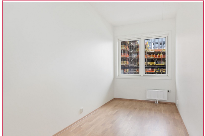
Soverom nummer to har også mulighet for stor seng og garderobe