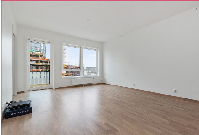
Stor stue med plass til sofa og spisebord