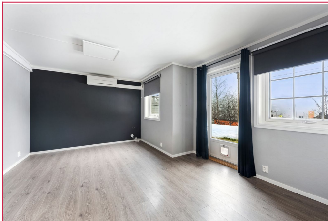
Romslig og lys stue med direkte utgang til terrasse – gir en luftig og åpen følelse.