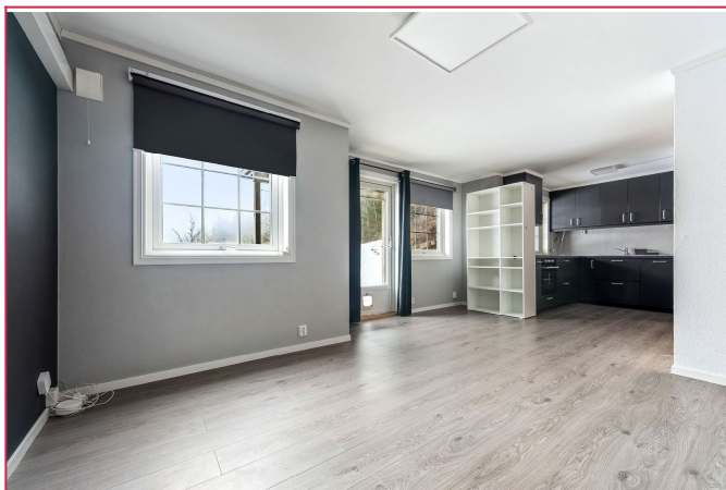
Lys og romslig stue med åpning til kjøkken, nye gulv og god plass til TV og sofagruppe.