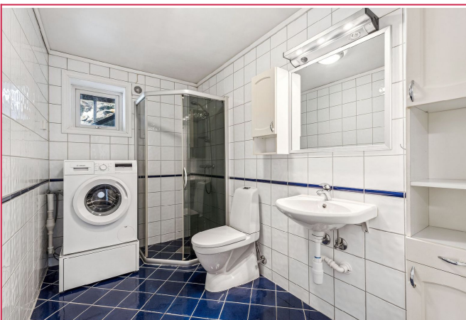
Eldre bad med vaskemaskin og dusjhjørne, funksjonelt og praktisk.