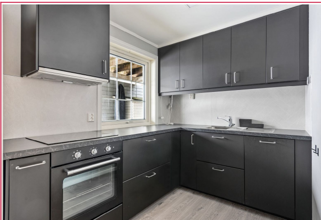
Stilrent kjøkken med moderne løsninger og godt med skap- og benkeplass.