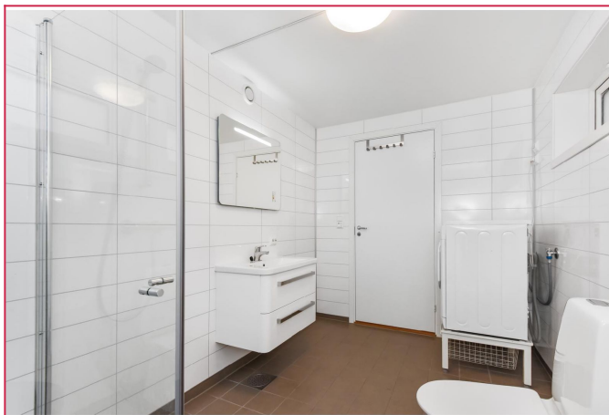
Bad med vaskemaskin