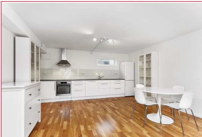
Kjøkken med spise plass