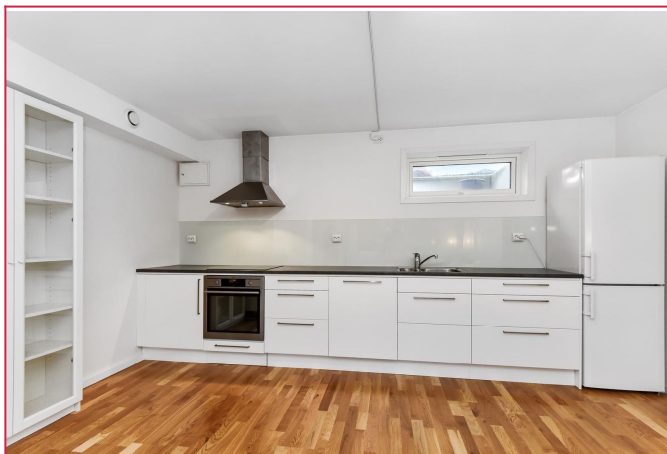
Kjøkken med alle hvitevarer