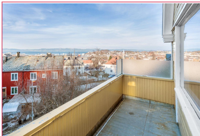
Fra stuen er det utgang til en solrik balkong med panorama utsikt.