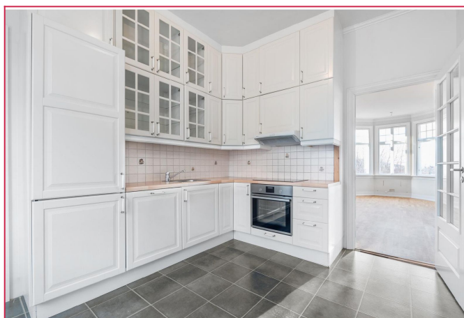
Pent kjøkken med mye skap -og benkeplass. Integreerte hvitevarer.