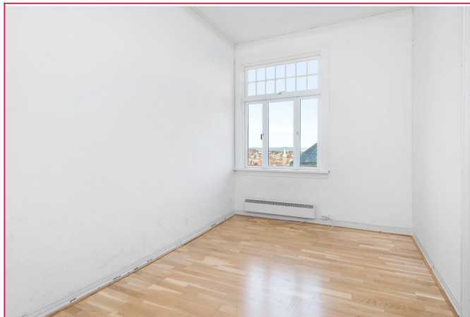
Leiligheten har 3 soverom av forskjellig størrelse. Rommene gir plass til både seng og garderobe.