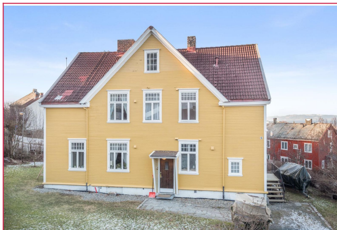
Leiligheten ligger i 2. etg med gode solforhold og fantastisk utsikt. Rolig og barnevennlig område.