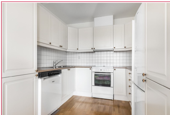
Kjøkkenet med frittstående hvitevarer