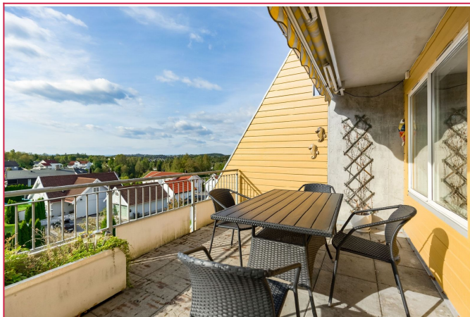
Flott og solrik terrasse