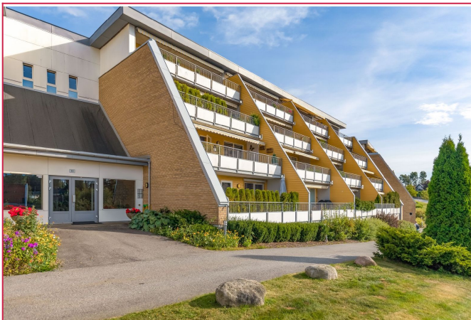
Fasade og nærområde