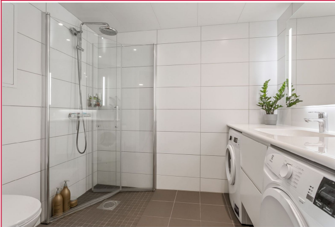
Delikat flislagt bad med vaskemaskin og tørketrommel