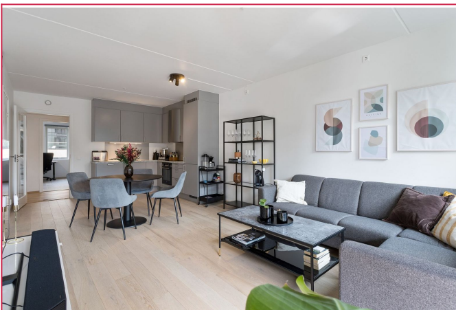
Pent kjøkken med diverse integrerte hvitevarer. Det er også god plass til spisebord