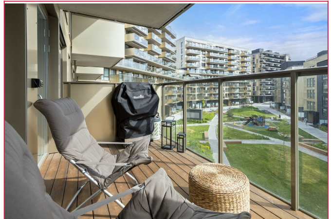
Pen og solrik, sør-vestvendt balkong mot hyggelig bakgård