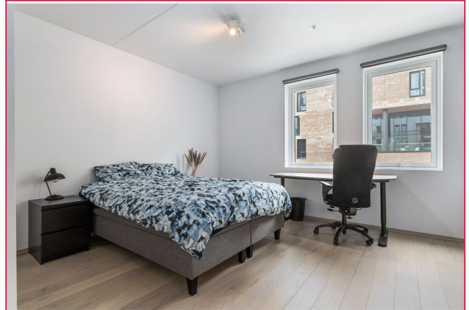
Soverom I av god størrelse