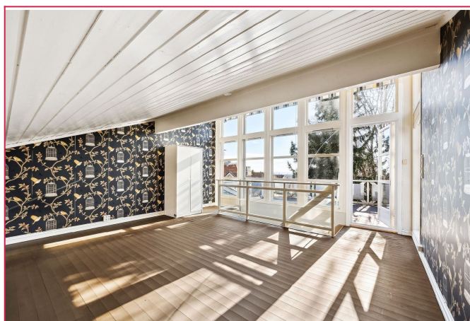
Loftstue/soverom/kontor. Utgang til egen terrasse.