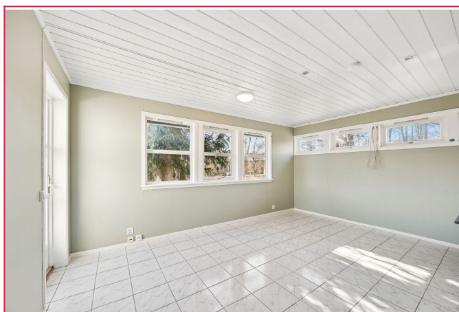
Soverom med utgang til hage