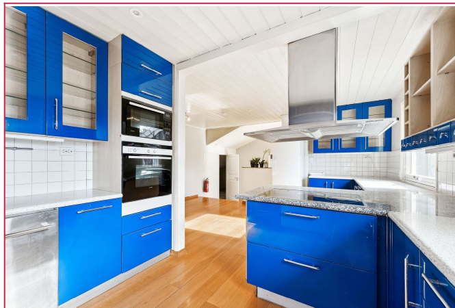
Eldre kjøkken. God skap- og benk plass.