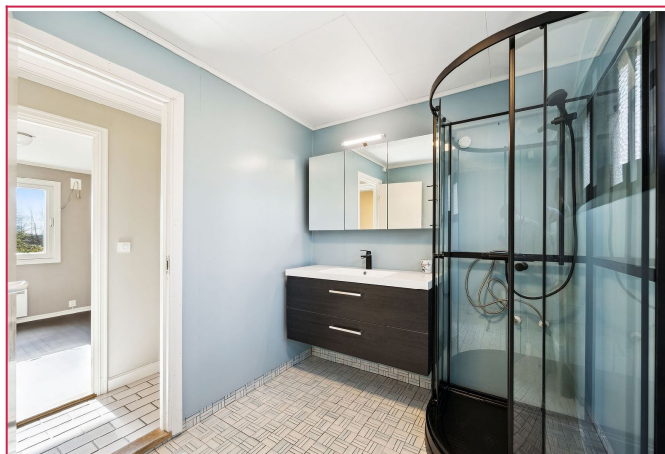
Bad med nytt dusjkabinett, servant og speilskap.