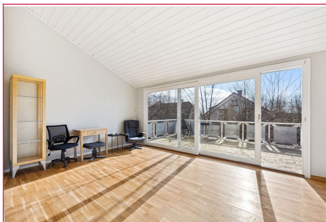
Stue med utgang til terrasse.