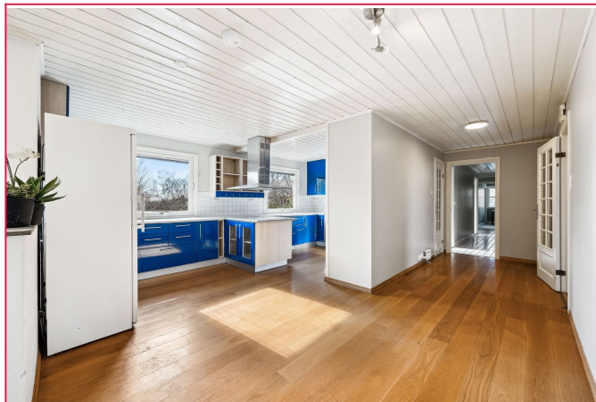
Romslig kjøkken med plass til spisebord