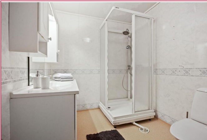
Bad med dusjkabinett og wc