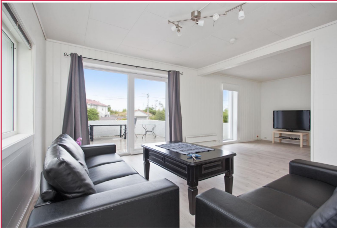
Stue med utgang til stor terrasse