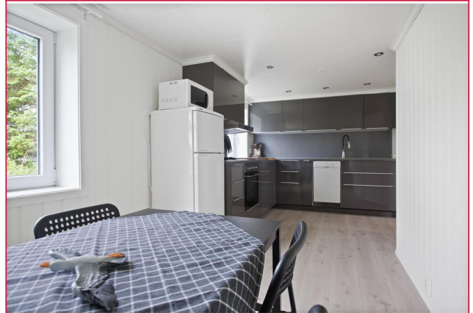
Kjøkken med spiseplass