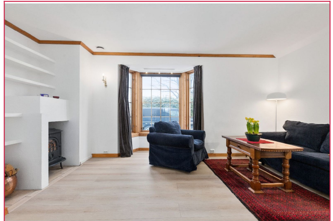
Det er kamin i stuen for kjørilige dager.