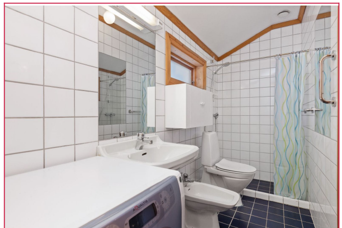
Bad med vaskemaskin, dusj, toalett, servant og varmekabler.