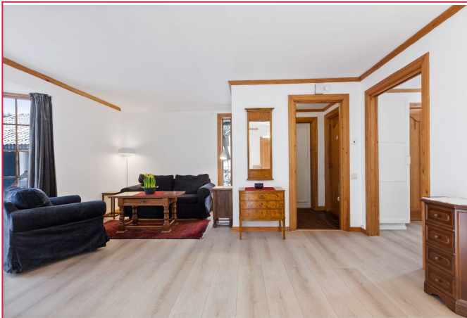
Stue med parkett - det er plass til salong og spisestue.