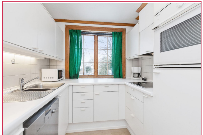
Fullt utstyrt kjøkken med hvitevarer.