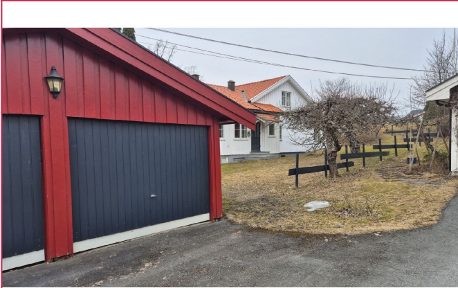
Halvpart av dobbeltgarasje som følger leiligheten.