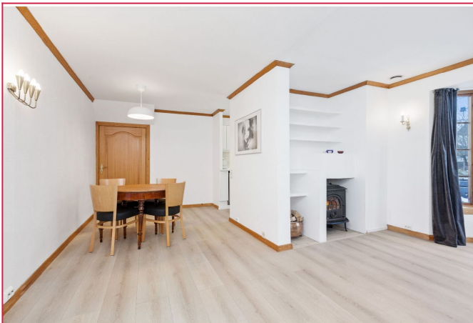
Innred med spisestue hvor du kan invitere venner og familie.