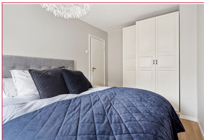
Romslig soverom med god skaplass