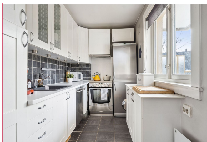
Lys og praktisk kjøkken