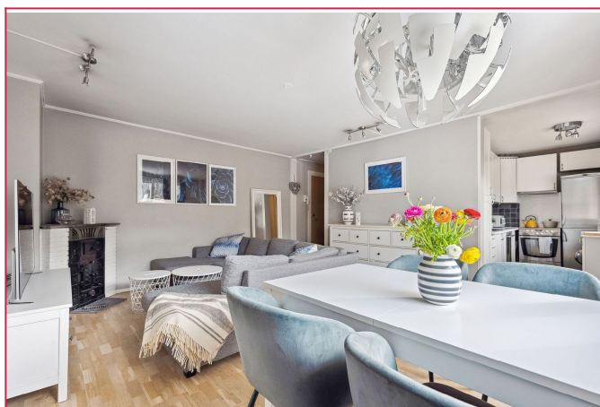
Stue mot kjøkken og gang