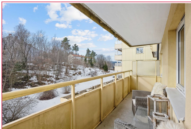
Overbygget balkong med gode solforhold.