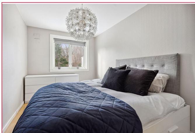
Soverom med god plass