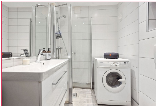
Flislagt bad med dusj og vaskemaskin