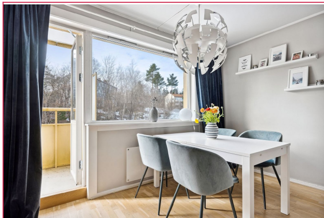
Hyggelig spiseplass i stuen med utg. balkong