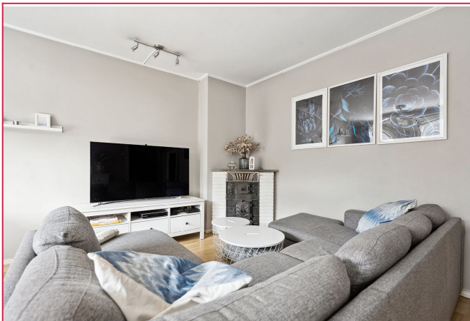
Stue med peisovn