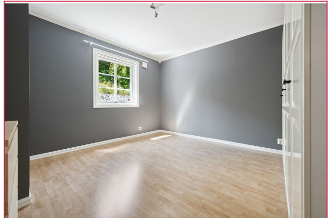
2 romslige soverom med garderobeskap