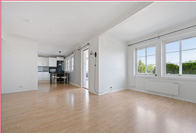
Stue med delvis åpen kjøkkenløsning - peis