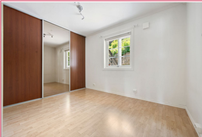
2 romslige soverom med garderobeskap