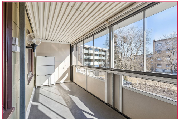
Stor, solrik og innglasset balkong