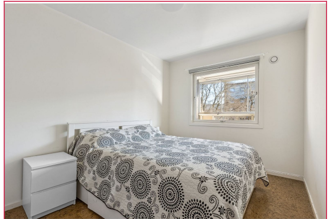
Romslig hovedsoverom med garderobeskap