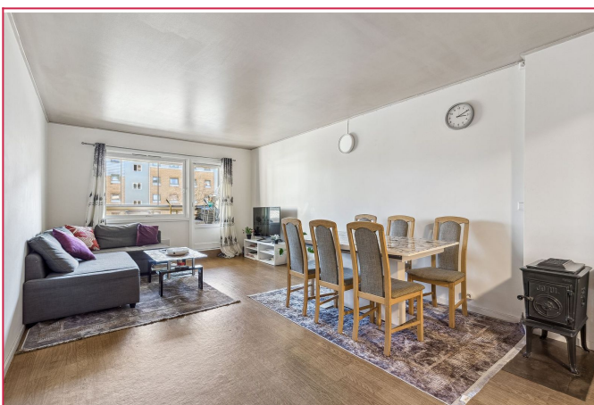
Stue med flere møbleringsmuligheter. Peisovn