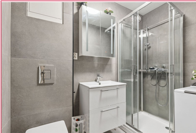
Nyere, pent oppusset bad med varme i gulvet