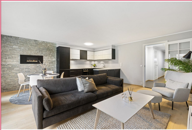
Innholdsrik leilighet med 1 soveorm.