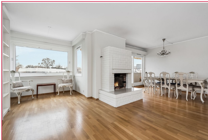
Romslig stue med utgang til balkong