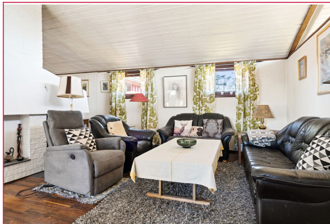
Stuen er meget romslig og god plass til flere soner