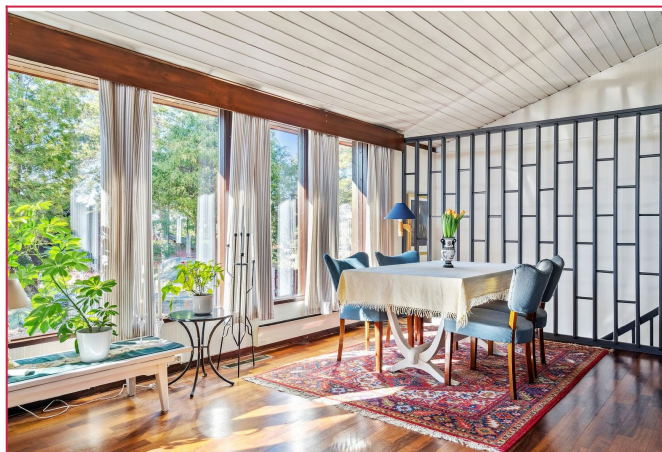
Store vinduer gir et godt og naturlig lys