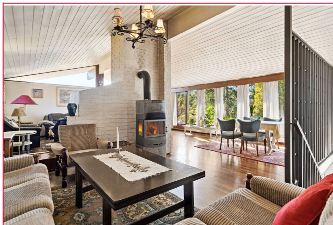
Stuen har vedovn og varmepumpe - det er også solcellepanel på taket