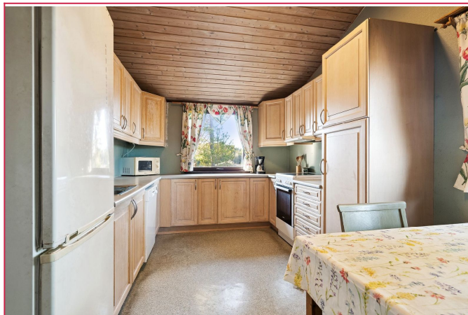
Kjøkkenet har godt med oppbevaring og benkeplass