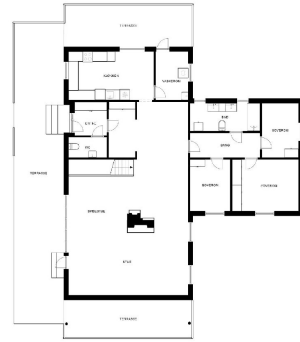
Plantegning av kjelleren

Plantegningene viser et bilde, og kan avvike fra det som er i virkeligheten. Det er ikke ansvar for EFXT for feil eller mangler i tegningene som følge av feil eller mangler i opplysningene som er gitt av opplysningskilden.