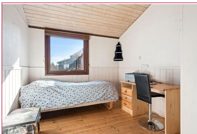
Boligens 1 av 3 soverom