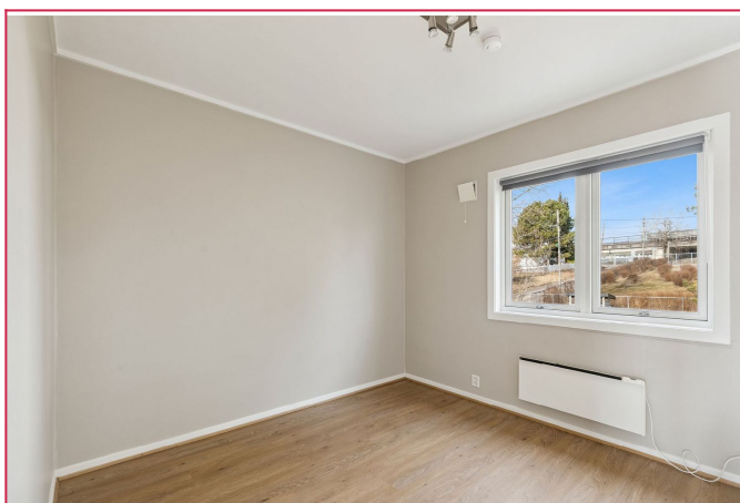
Soverom - minste, med inngag fra stue