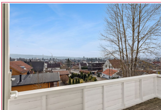
Balkong - solrik og med utsikt