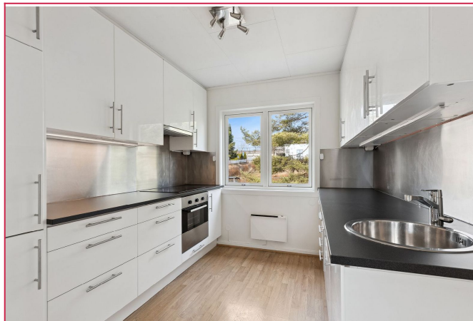
Kjøkken - helt ny benkeplate