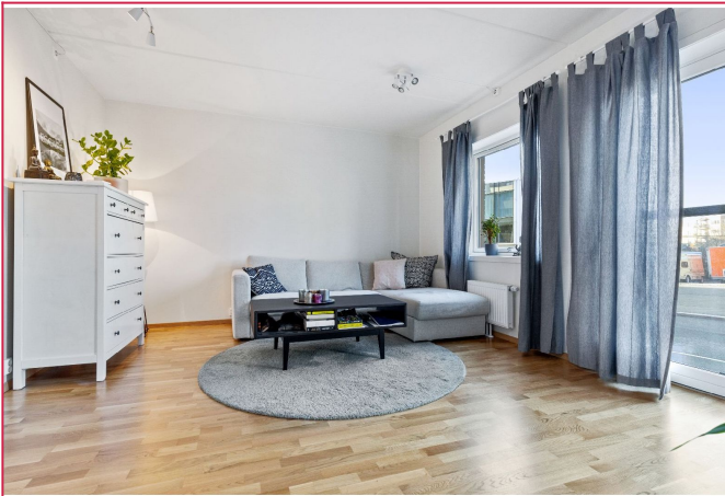
Velkommen til Sigurd Hoels vei 17!