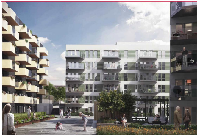
Illustrasjon fasade og uteområde