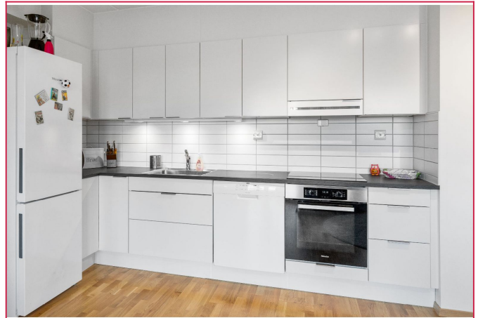
Åpen kjøkken/stueløsning. Kjøkkenet med hvitevarer.