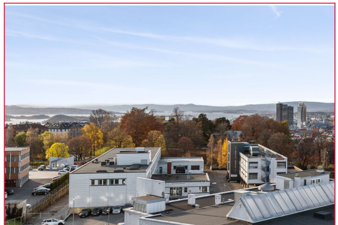
Utsikt fra takterrassen.