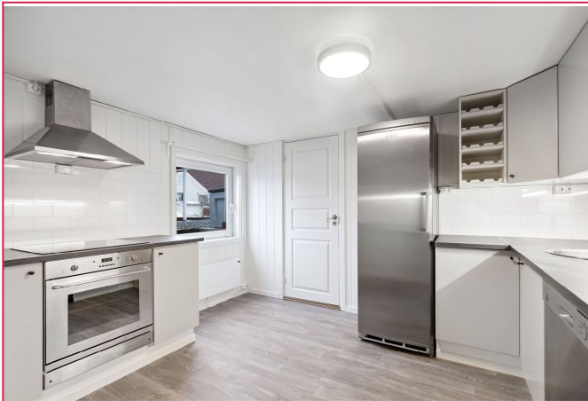
Moderne kjøkken med hvitevarer