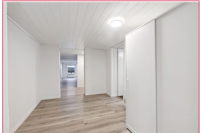
Gang med garderobeskap