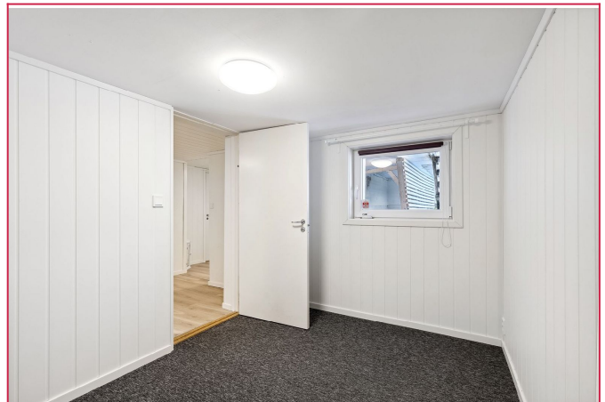
Soverom med plass til dobbeltseng