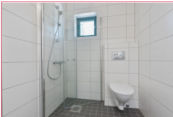
Boligen har et lyst og fint bad.