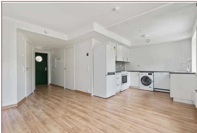
Stuen har åpen kjøkkenløsning med god plass til sofagruppe.