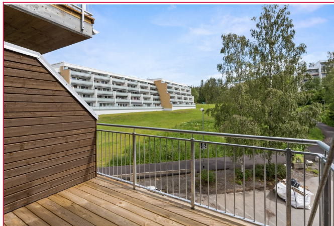
Boligen har en privat balkong.