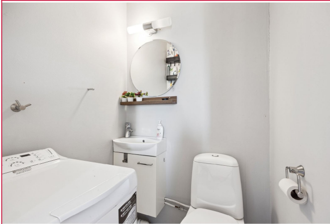
Separat toalett med toppmatet vaskemaskin, servant og toalett.