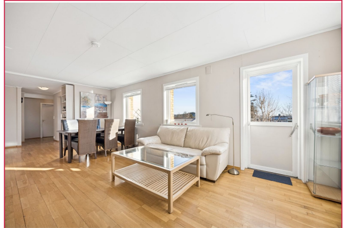
Det er utgang til uteområdet fra stuen.