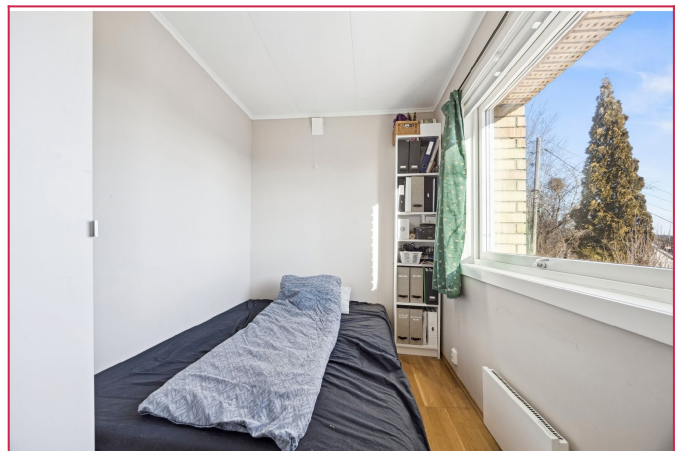
Det minste soverommet.