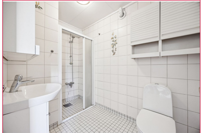
Flislagt bad med varmekabler, dusj, servant og toalett.