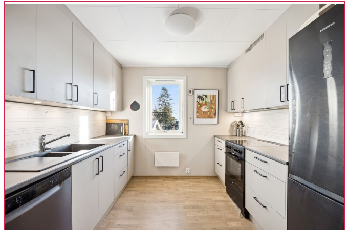
Kjøkken med mye skap- og benkeplass. Oppvaskmaskin, kombi kjøleskap og komfyr.