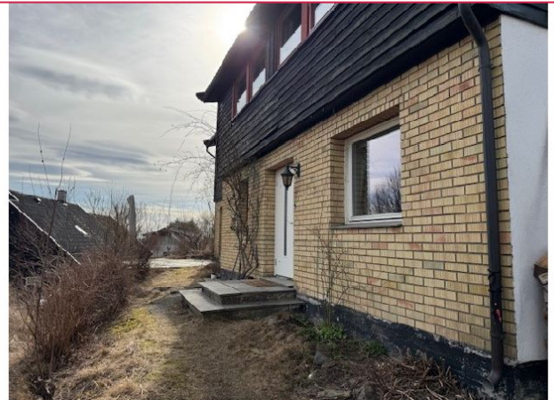
Tomannsbolig med store uteområder. Det følger med en liten utebod.