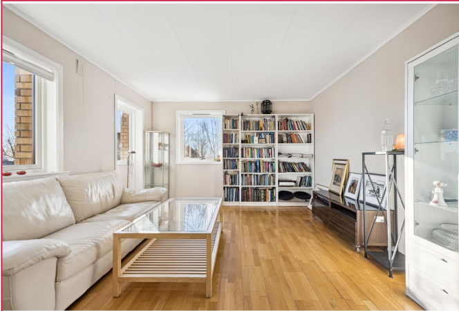
Stuen er romslig med plass til salong og spisestue.