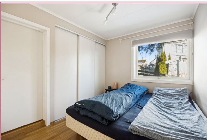
Det største soverommet med en stor garderobe.