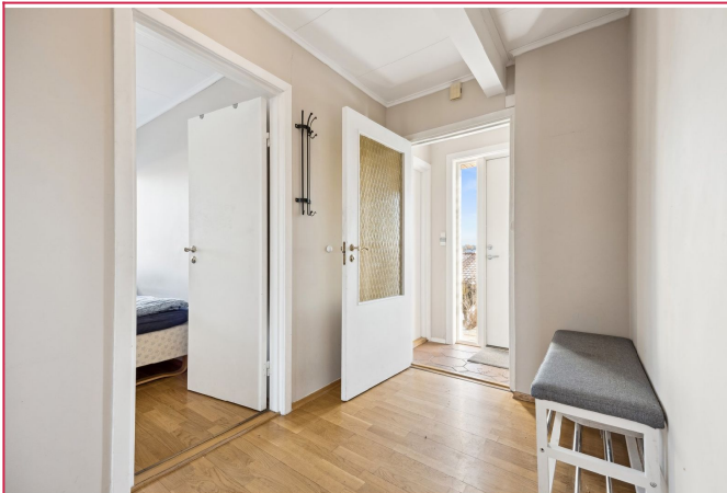
Entré med mulighet til å sette inn garderoberkapp.