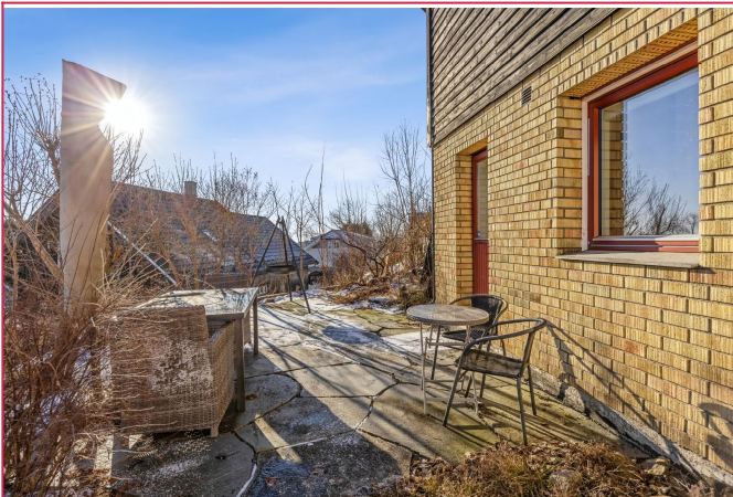
Solrik uteplass med heller. Utgang fra stue.