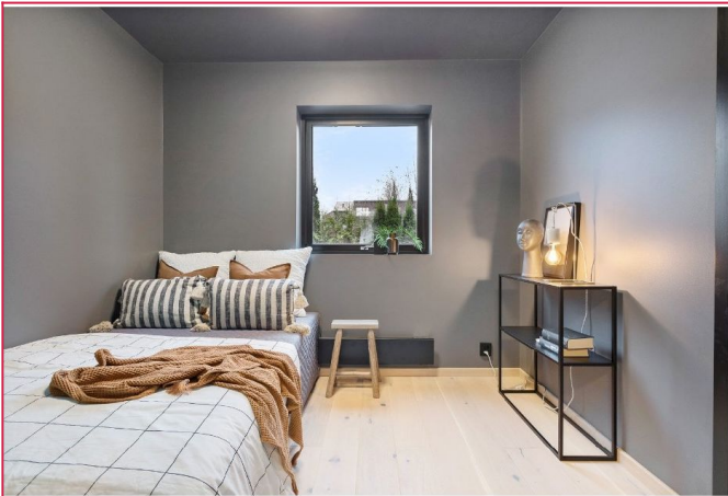
Luftig soverom plass til dobbeltseng