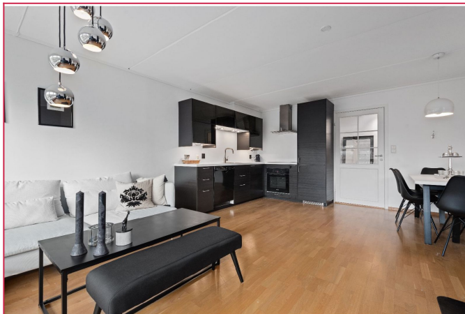
Pent kjøkken med god skap- og spiseplass