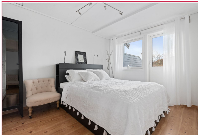
Soverom innredet med dobbeltseng og skap for oppbevaring