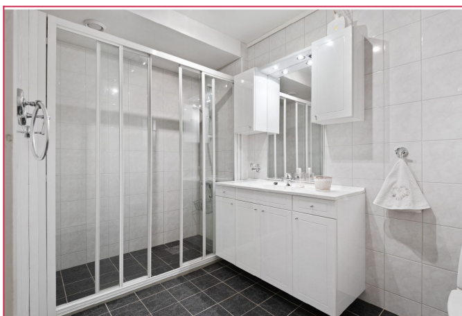
Helfliset bad innredet med servant med møblement/speil, toalett og dusjhjørne