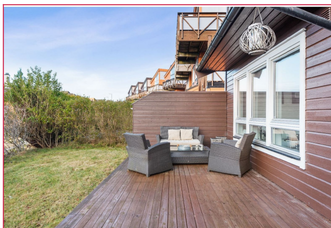
Solrik uteplass med flott utsikt over nærområdet