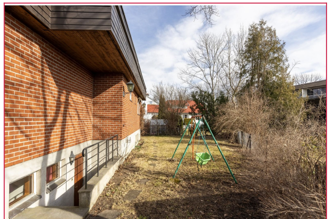
Velkommen til visning!