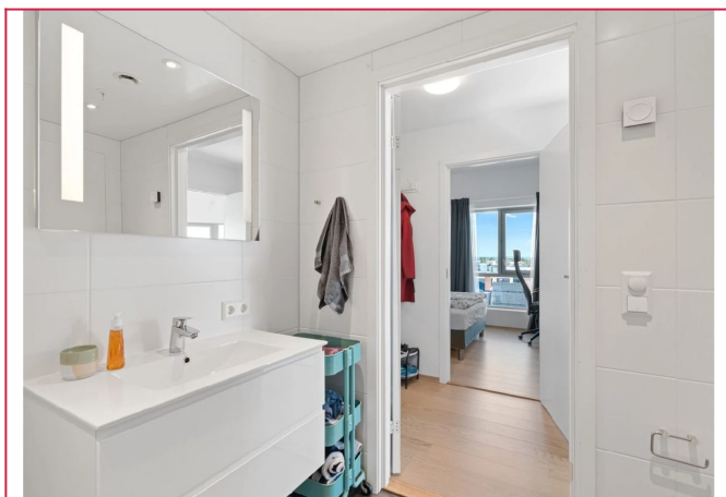
Badet er, som resten av leiligheten, fra 2020 og holder god standard.