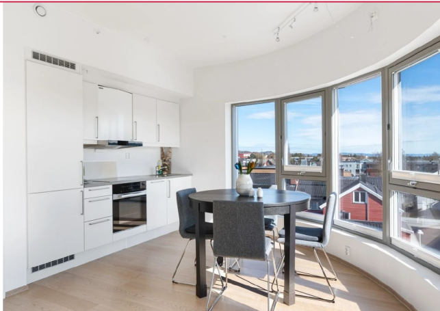
Leiligheten har et unikt særpreg med buet utforming av stue/kjøkken.