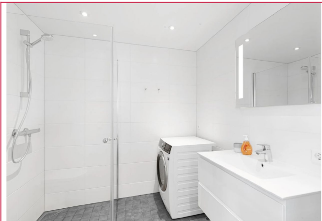
Flislagt bad med downlights i himlingen.