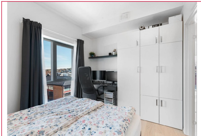
Det er store vindusflater i leiligheten, noe som gir en lys atmosfære.