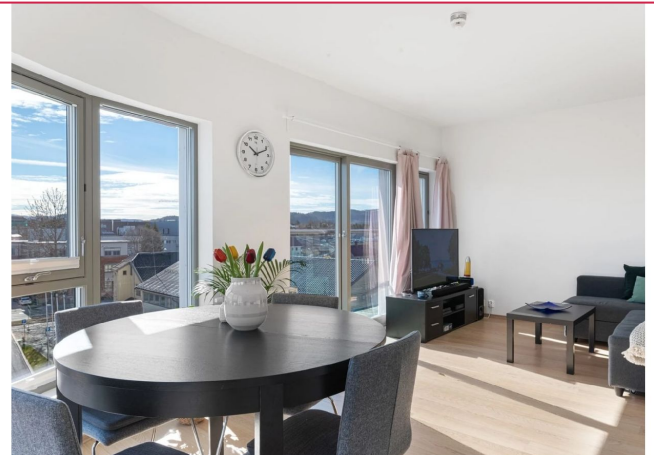
Leiligheten har skyvedør ut til en luftebalkong.