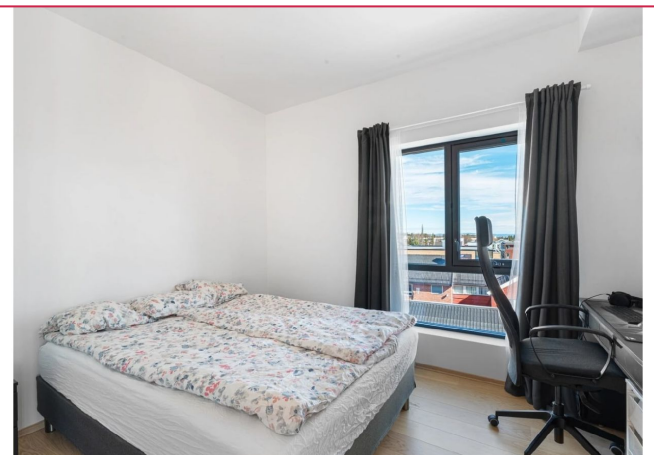
Byggeår i 2020 tilsier gjennomgående god standard.