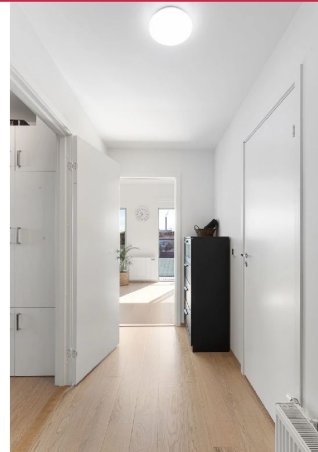
Varmtvann, fjernvarme, TV og internett inkludert i leien.