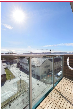
Med hjørnebeliggenhet i øverste etasje har man god utsikt.