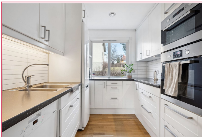
Pent kjøkken med rikelig skap- og benkeplass.