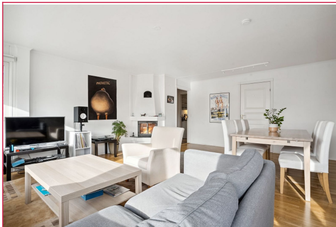
Leiligheten har en praktisk planløsning.