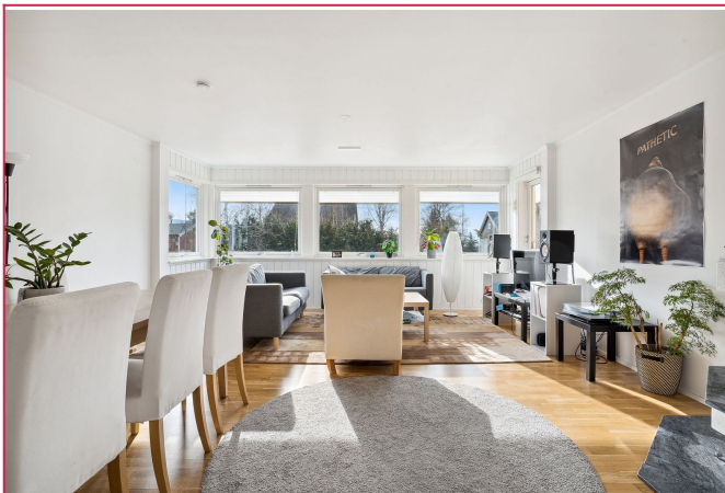
Store vindusflater bidrar til rikelig med naturlig lysinnslipp. Internett inkl. i husleie.