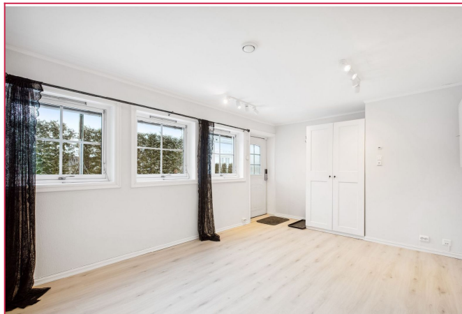
Lys og pen stue