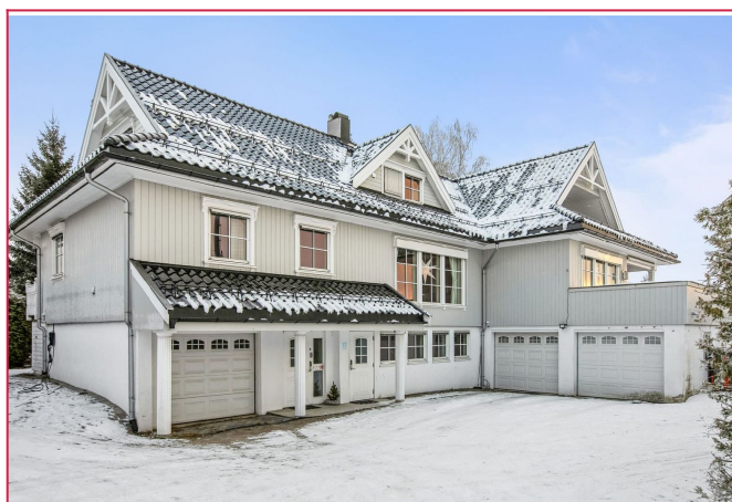
Parkering på eiendommen.