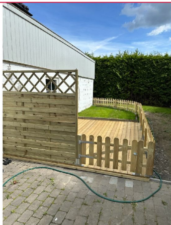
Terrasse tilhørende leiligheten.