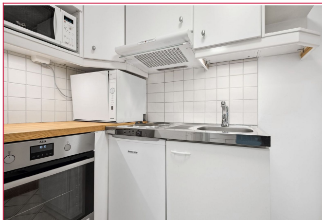
Praktisk kjøkken med hvitevarer.