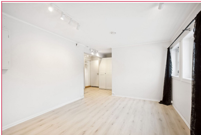
Leiligheten er nyoppusset i år.