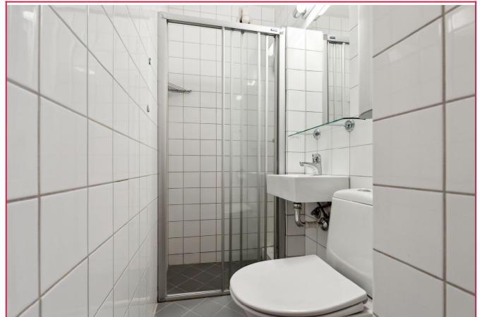
Pent flislagt bad med varmekabler.