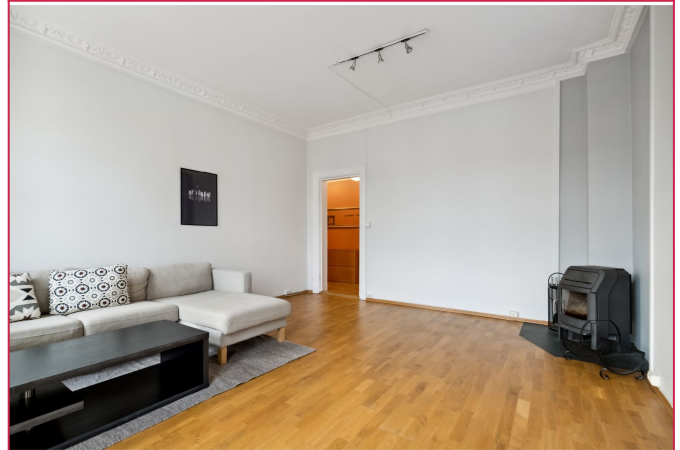
Stor stue med plass til sofa- og spisegruppe.