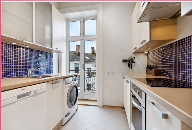
Separat kjøkken med utgang til balkong.