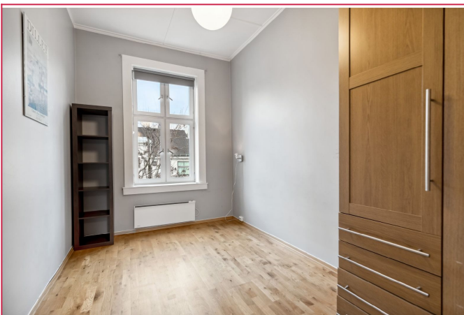
Soverom med plass til dobbeltseng.