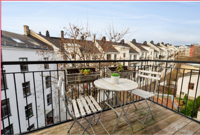
Hyggelig balkong med gode solforhold.