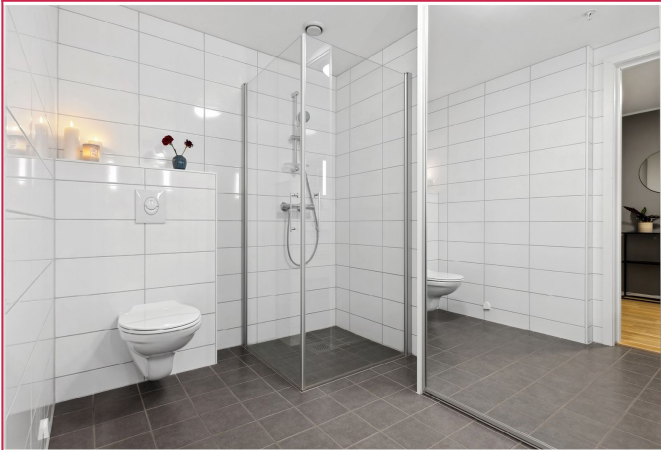
Flislagt bad med varme i gulvet