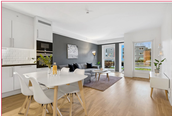
Fra stuen er det utgang til terrasse - Stuen varmes opp med fjernvarme.