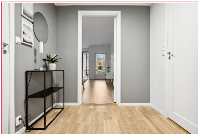
Entre med god plass til å henge fra seg ytterjakker og sko - Innvendig bod med klesoppheng