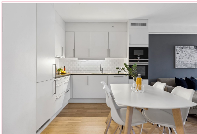
Kjøkkenet har hvite slette fronter og fliser over kjøkkenbenk - Hvitevarer er integrert