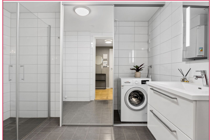
Bad - Vaskemaskin gjemt bak skyvedørgarderobe med speil.