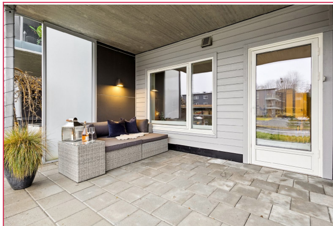
På terrassen er det god plass til utemøbler og grill på sommeren