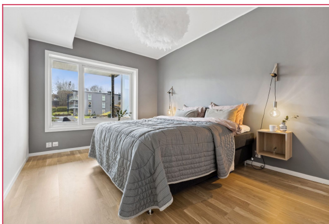
Soverom av god størrelse