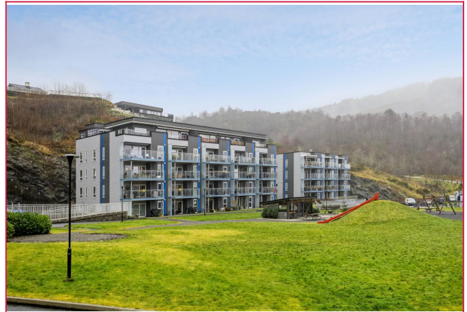
Velkommen til Totlandsvegen 80 E!