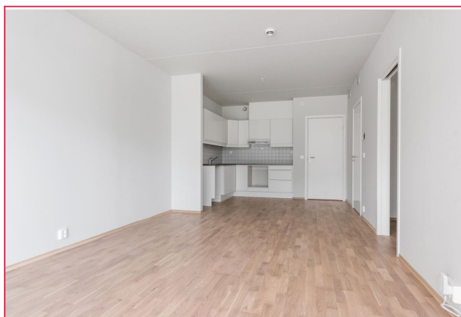
Kjøkken fra Sigdal