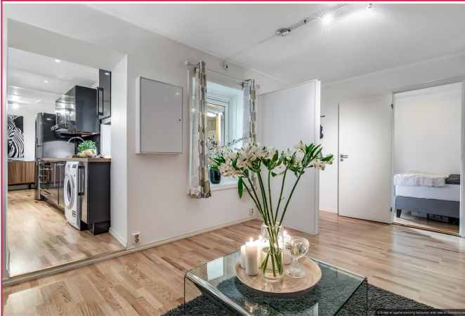
En pen og moderne 2.romsleilighet med beliggenhet i Trondheim sentrum!