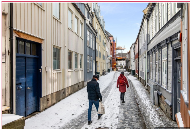
Leiligheten ligger i en hyggelig gate i sentrum med lite gjennomgang