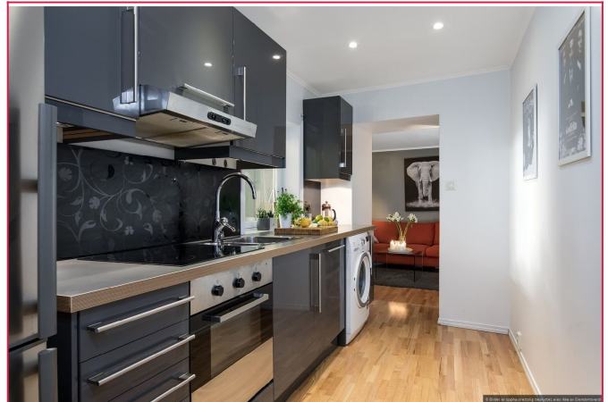
Alle hvitevarer medfølger