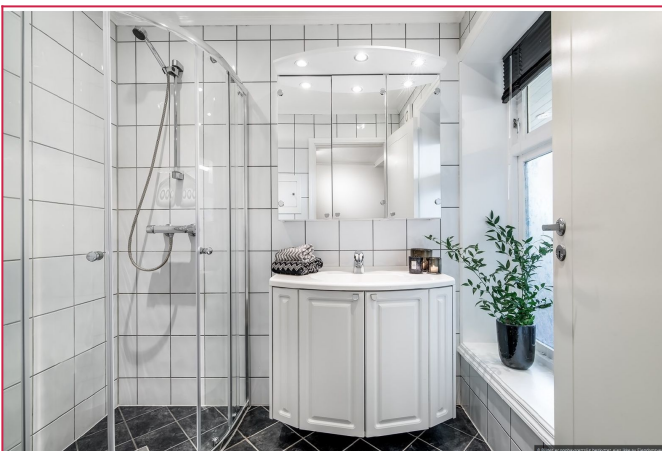
Lyst og pent flislagt bad!