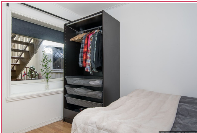
Leiligheten ligger i 1 etasje, med vindu mot skjermet bakgård