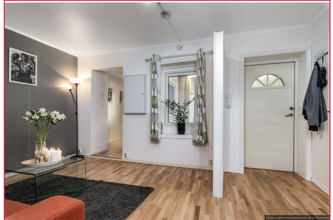
Boligen består av Stue/gang i åpen løsning, kjøkken, bad og soverom.