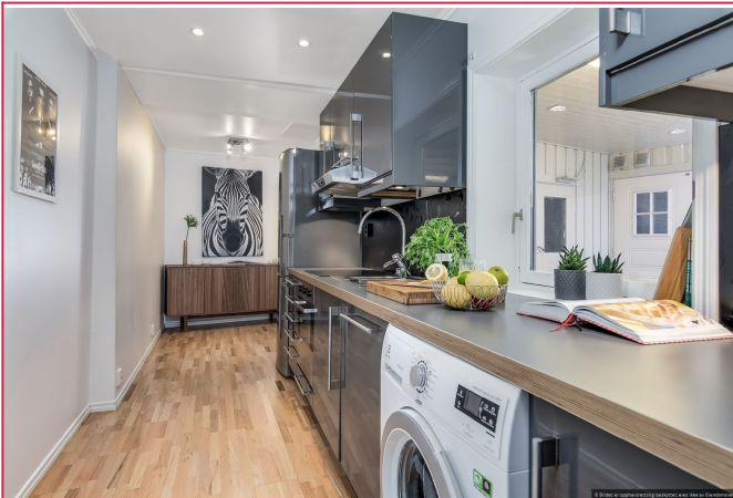
Kjøkkenet er moderne med god skap og- benkeplass