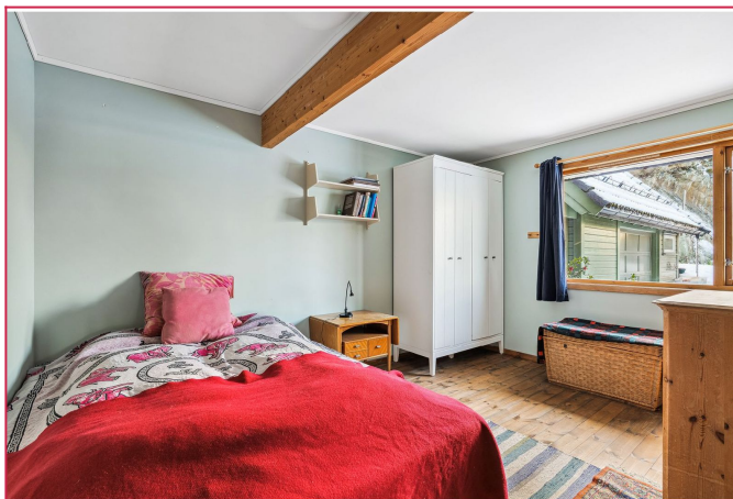
Romslig soverom med plass til dobbeltseng.