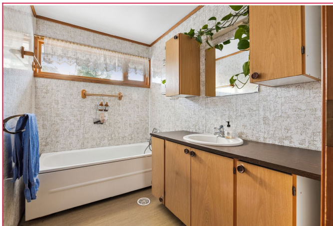
Fint bad med badekar og servant m/innredning.