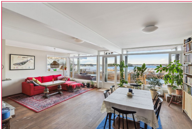
Stuen har store vindusflater som slipper inn godt med sollys og direkte utgang til balkong.