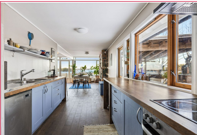
Pent kjøkken i lyseblå fronter med alt av hvitevarer.