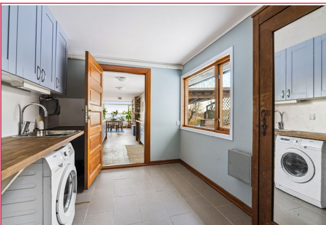
Entré med vaskerom.