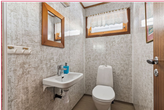
Seperat toalettrom med toalett og vask.