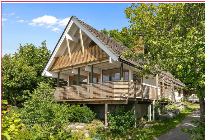
Velkommen til visning!