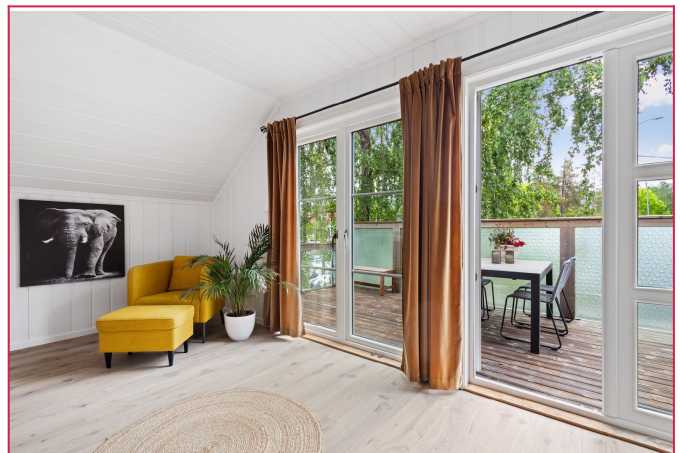
Ut mot balkong på 20 kvm mot syd