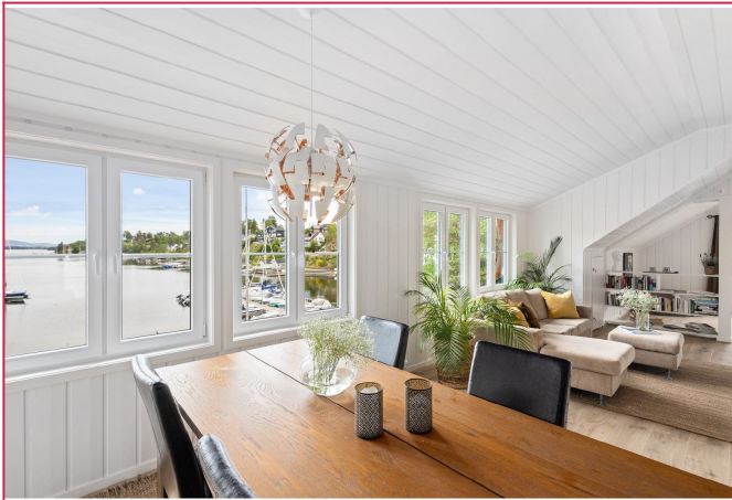
Spisestue mot stue