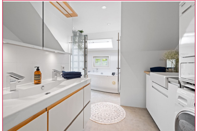
Bad med dusj og badekar og vaskesøyle