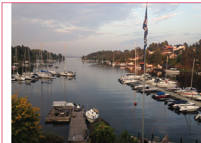
Utsikt over Halsbukten