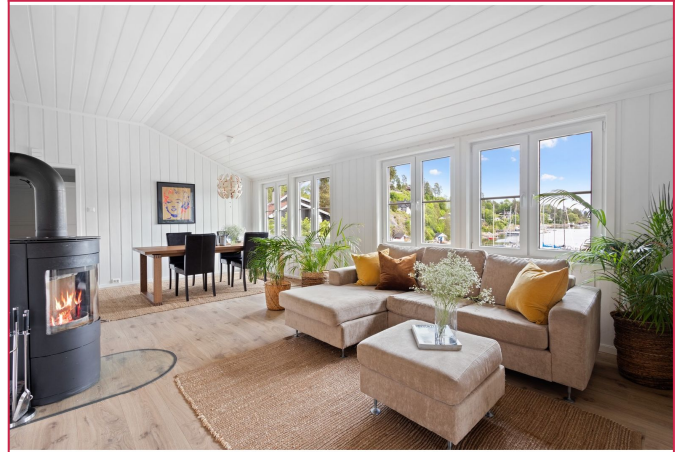
Stue med peis