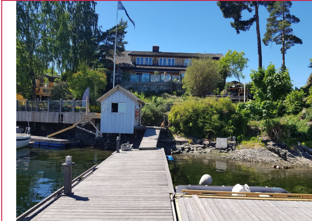
Utsikt mot huset fra bryggen