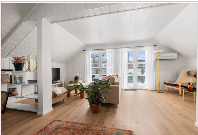
Utgang til stor balkong