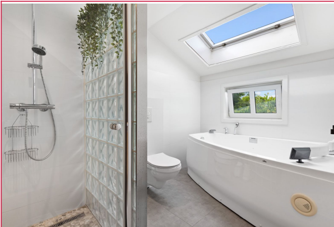
Bad med dusj og badekar