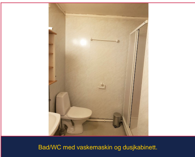
Bad/WC med vaskemaskin og dusjkabinett.