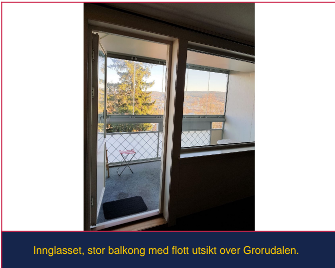
Innglasset, stor balkong med flott utsikt over Grorudalen.