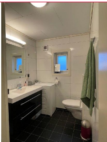
Flott bad med varme i gulv