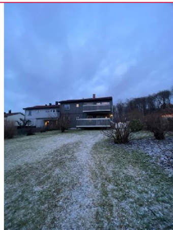
Tilgang til stor hage