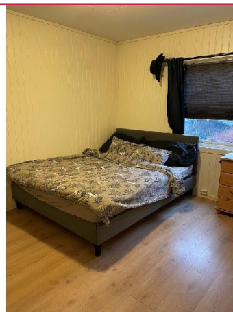
2 soverom, begge av god størrelse