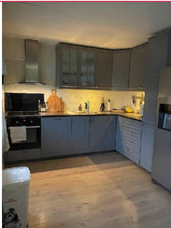
Mye skap og benkeplass på kjøkken