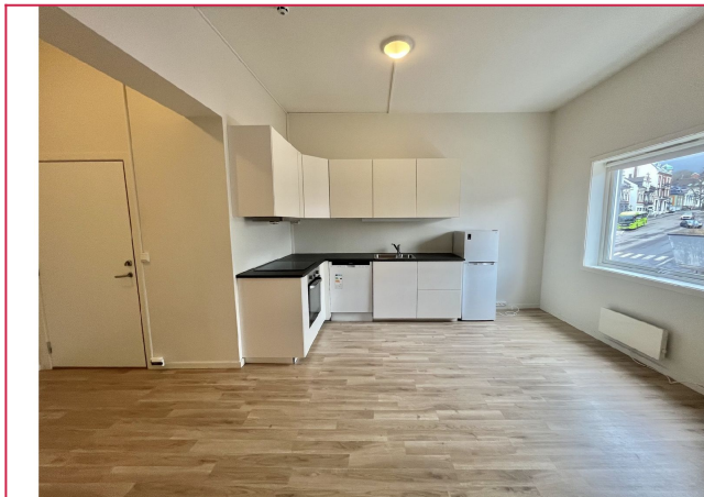
Kjøkken og entrè