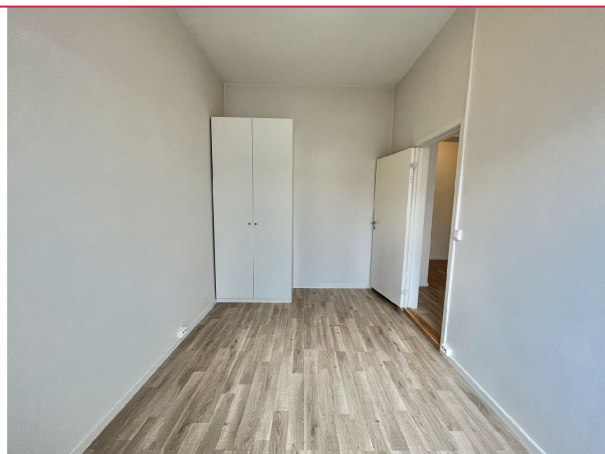
Soverom nr 1