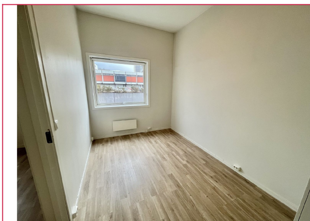
Soverom nr 1