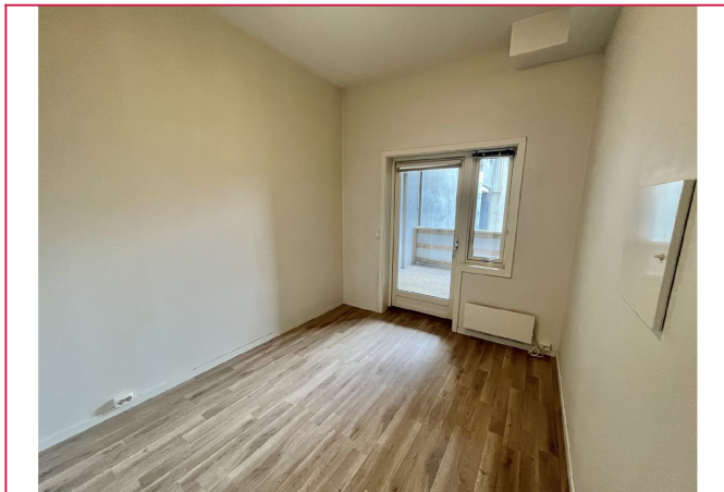
Soverom nr 2 med utgang til balkong