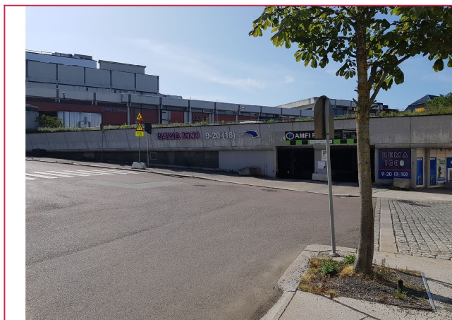
Amfi Moss senter