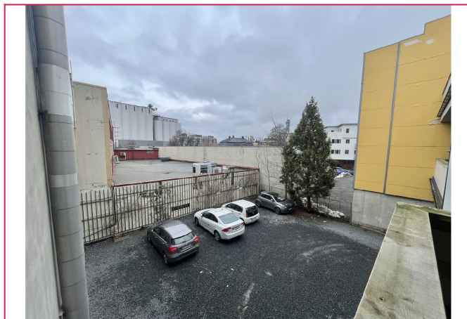
Parkeringsplass og bakgård